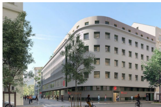
Architecte – maître d'œuvre : Cabinet Milk Elisa Soria

La réhabilitation du site d'Arsonval, financée par le plan de relance, comprend la rénovation de la résidence actuelle et la transformation du siège du Crous en résidence de studios avec 57 nouveaux logements dans des délais extrêmement courts pour une ouverture à la rentrée 2023.