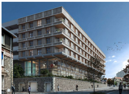
Architecte – maître d'œuvre : Chabal Architectes

La livraison, à la rentrée 2023 également, d'une résidence de 120 places sur le site du Cadran solaire viendra diversifier l'offre de logements étudiants à caractère social à proximité du site Santé, sur la commune de la Tronche qui dispose actuellement d'une résidence de 300 chambres de 9 m 2 réhabilitées.