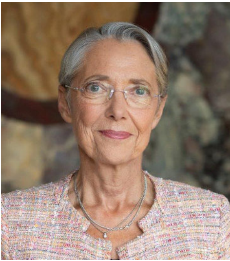
Élisabeth Borne Première ministre

« Le combat continuera jusqu'à ce que l'égalité ne pose plus de questions. »